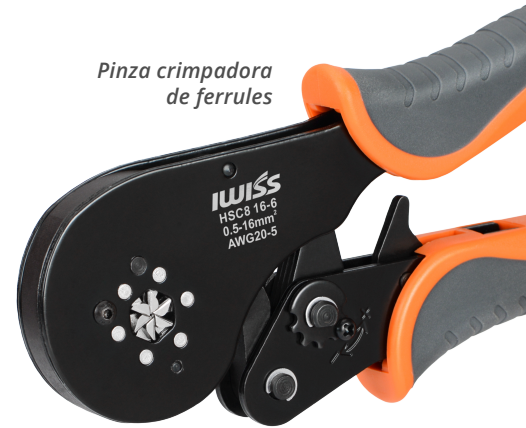
Pinza crimpadora de ferrules